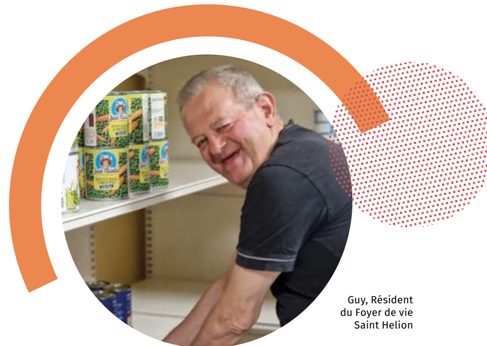
Guy, Résident du Foyer de vie Saint Hélon

J'ai travaillé à l'ESAT, alors j'aime bien continuer à faire du travail. C'est bien pour moi. Et puis je suis utile.