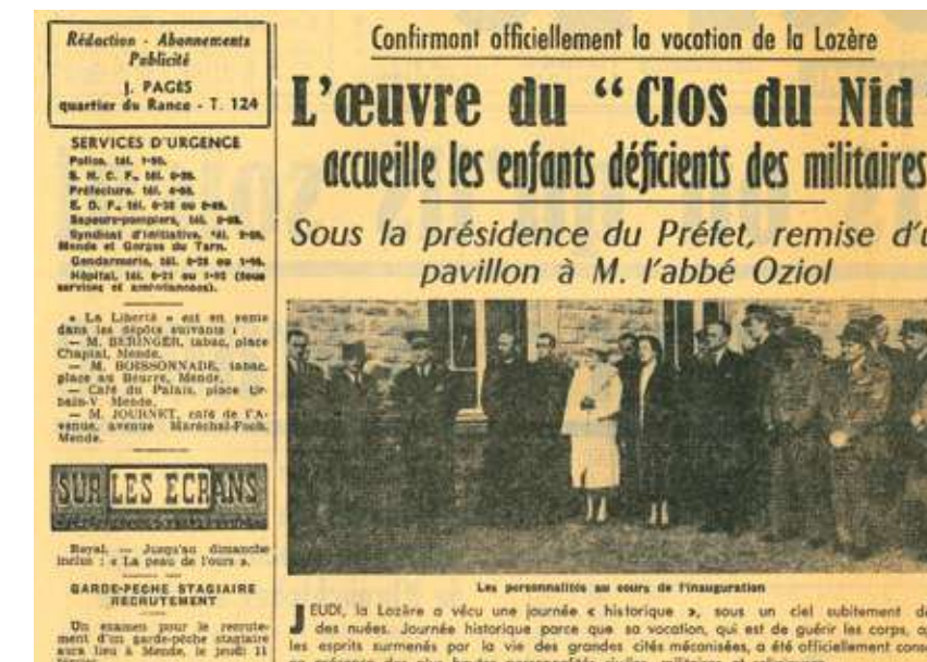
La Liberté, le journal du Massif central du 31 janvier 1960